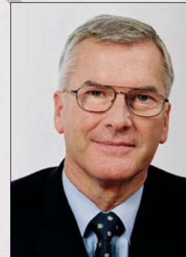
Dkfm. Werner Kraus, Präsident des ÖAMTC

Ich wünsche dem Veranstalter und den Teilnehmern ein erfolgreiches und unfallfreies Motorsport-Wochenende.